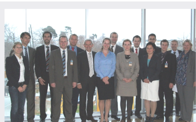
Abbildung 3: Gruppenfoto des Gründungstreffens des Facharbeitskreises Green Controlling.

Das Ziel des Facharbeitskreises Green Controlling ist die Schaffung einer ICV-Definition „Green Controlling“ und die Ausarbeitung einer Agenda, wie ein ökologieorientiertes Controlling in der Unternehmenspraxis umgesetzt werden kann. Die Ergebnisse sollen im Rahmen eines Sammelbandes veröffentlicht werden.