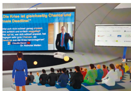
Die virtuelle 3-D-Umgebung der CCS 2020.

Die traditionellen ICV-Fachtagungen im Herbst – CAB, CTS, CIB, ICCS, CCS und CIS – fanden 2020 Corona-bedingt online statt. Dabei wurde viel experimentiert, wichtige Erfahrungen konnten gesammelt werden. Die bei der Online-CCS-2020 eingesetzte Plattform sorgte für großes positives Aufsehen. In der nächsten Ausgabe des CM berichten wir über die Tagungen. ■